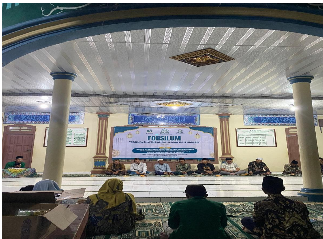
Gambar 1. Kegiatan FORFILUM yang dihadiri oleh ulama, umaro, dan masyarakat Desa Sriminosari.

Gambar 1 ini merupakan dokumentasi kegiatan Forum Silaturahmi Ulama dan Umaro (FORFILUM) yang kami selenggarakan pada tanggal 24 Februari 2025 di Masjid Baiturrahim, Dusun 4, Desa Sriminosari. Dalam gambar ini, terlihat suasana diskusi yang berlangsung dengan partisipasi aktif dari para ulama, umaro, dan masyarakat setempat. Kami sengaja memilih masjid sebagai lokasi kegiatan karena selain sebagai pusat kegiatan keagamaan, masjid juga menjadi simbol persatuan dan harmoni dalam masyarakat. Gambar ini diambil pada saat salah satu sesi diskusi berlangsung, di mana