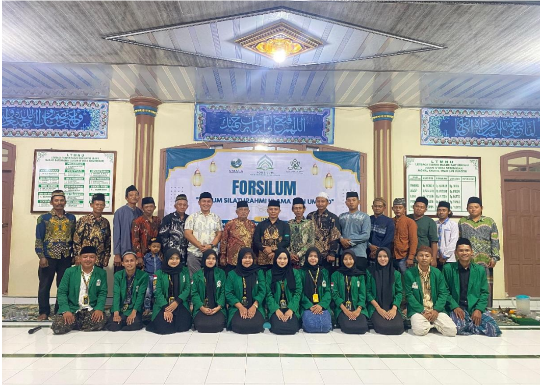
Gambar 2. Foto bersama Ulama, Umara bersama Mahasiswa KKS

para tokoh agama dan tokoh masyarakat sedang menyampaikan pandangan mereka tentang pentingnya moderasi beragama. Kami merasa gambar ini berhasil menangkap momen penting dari kegiatan FORSILUM, di mana semua pihak terlibat dalam dialog yang konstruktif untuk membangun kehidupan beragama yang lebih toleran dan harmonis.