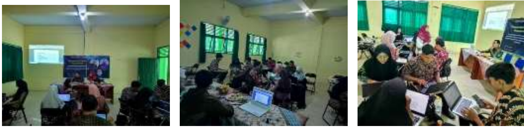
Gambar 1. Kegiatan Pelatihan

Berdasarkan hasil observasi selama kegiatan, peserta pelatihan mempunyai antusiasme yang tinggi dalam mengikuti seluruh rangkaian kegiatan. Berikut beberapa visualisasi kegiatan dalam PKM ini. Selanjutnya berdasarkan hasil survei setelah dilakukan pelatihan diperoleh hasil yang cukup memuaskan. Dari aspek pemahaman diketahui sebesar 36,8% peserta menyatakan sangat paham, sebanyak 47,7% peserta menyatakan paham terhadap materi yang diberikan, sementara terdapat 15,8% yang menyatakan cukup paham dengan materi PKM yang diberikan. Hasil lengkap survei pemahaman materi pelatihan dapat dilihat dari diagram berikut. Diagram ini diambil dari ringkasan hasil survei di Google Formulir .