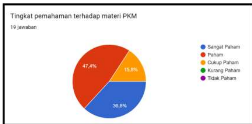
Gambar 2. Persentase tingkat pemahaman terhadap materi pelatihan

Berdasarkan hasil observasi selama kegiatan, peserta pelatihan mempunyai antusiasme yang tinggi dalam mengikuti seluruh rangkaian kegiatan. Berikut beberapa visualisasi kegiatan dalam PKM ini. Selanjutnya berdasarkan hasil survei setelah dilakukan pelatihan diperoleh hasil yang cukup memuaskan. Dari aspek pemahaman diketahui sebesar 36,8% peserta menyatakan sangat paham, sebanyak 47,7% peserta menyatakan paham terhadap materi yang diberikan, sementara terdapat 15,8% yang menyatakan cukup paham dengan materi PKM yang diberikan. Hasil lengkap survei pemahaman materi pelatihan dapat dilihat dari diagram berikut. Diagram ini diambil dari ringkasan hasil survei di Google Formulir .